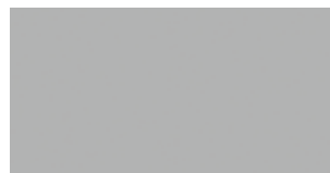
Weißaluminium, RAL 9006